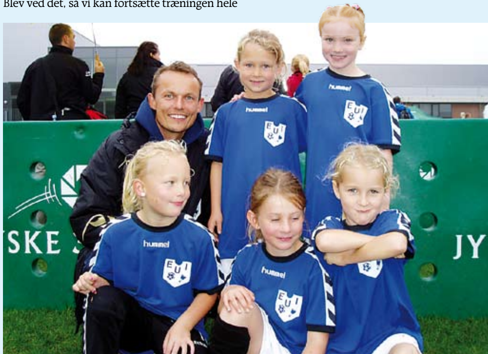
Engum UI's piger årgang 2003 deltog ved det store 3-bold stævne i Juelsminde den 12. september. Et rigtig godt stævne, hvor der udover fodbold var mulighed for hoppeborg, og så var der store medaljer til alle spillerne.

Der har desværre været lidt frafald af ældre spillere, men der til gengæld er kommet flere til i de yngre årgange. For de ældre årgang skal der stadig arbejdes ekstra med at fastholde spillerne og i den forbindelse arbejdes der med flere forskellige initiativer – herunder er deltagelse i et stævne i udlandet, udover Tysklandsturen, under overvejelse.