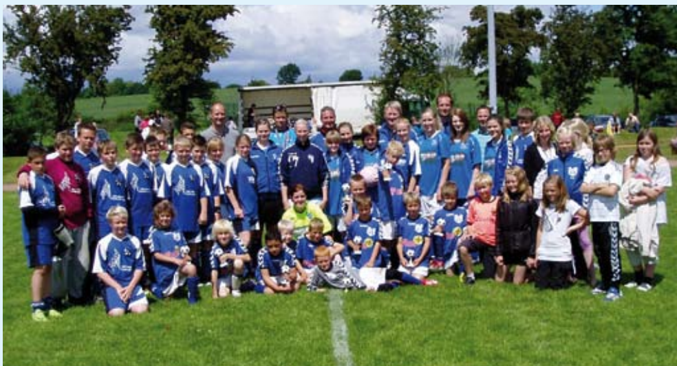
Hele "Tysklandsholdet", sommeren 2010.