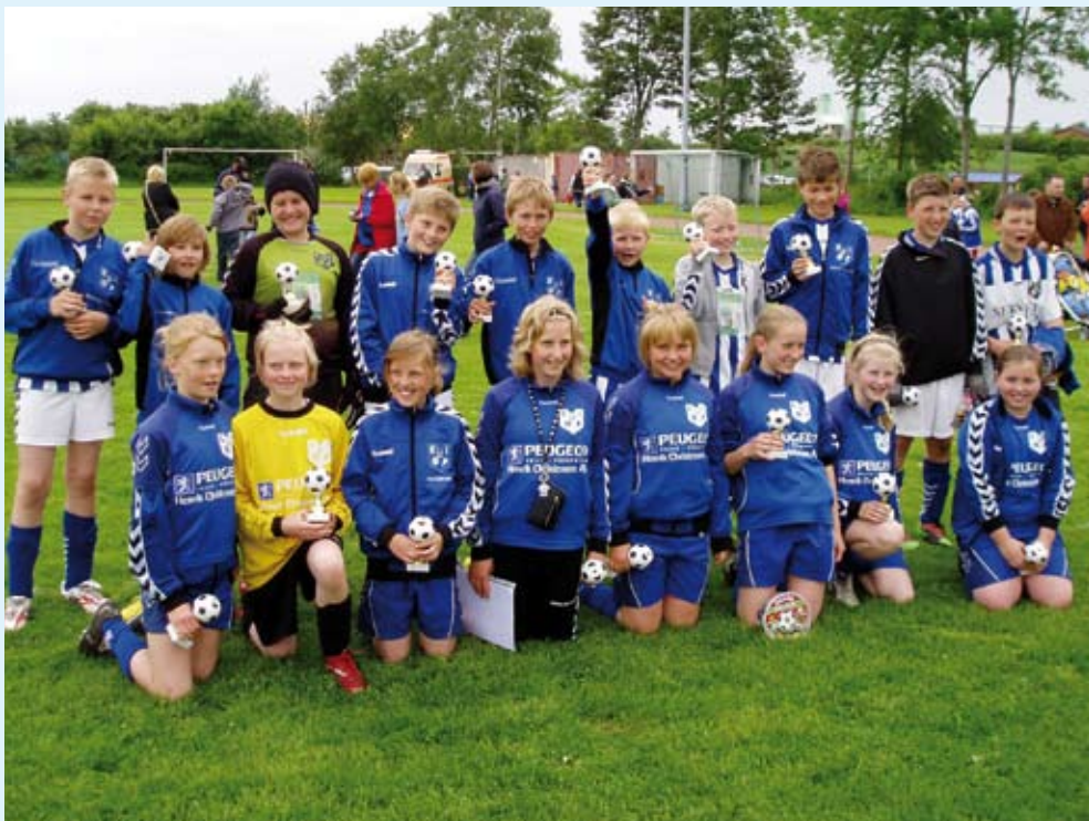
Drenge og piger årgang 1997 og 1998 der var med på turen til Tyskland i sommeren 2010.